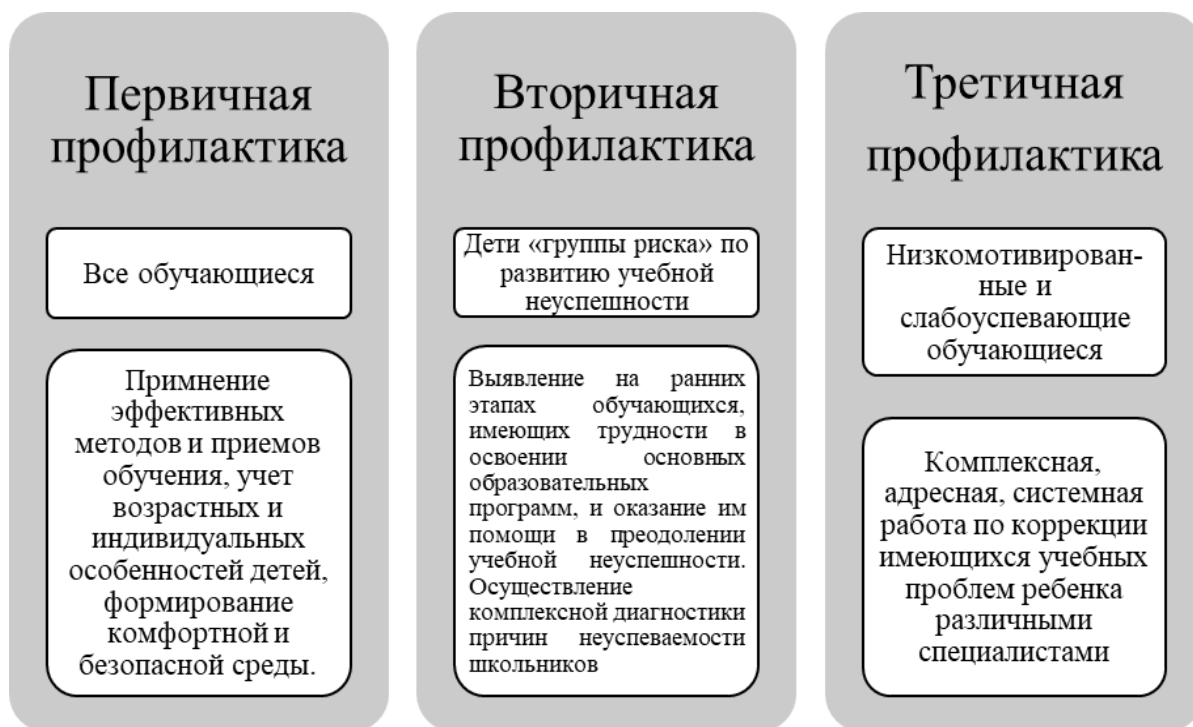
Рис. 1. Виды профилактики учебной неуспешности

Отличительной особенностью документа является то, что в нем продемонстрированы общие подходы к организации педагогической деятельности по профилактике учебной неуспешности. В частности, показано содержание работы субъектов превентивной деятельности (руководящих и педагогических работников) на уровнях первичной, вторичной, третичной профилактики (рис. 1).