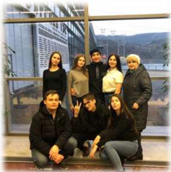
АО «Красноярская ГЭС»