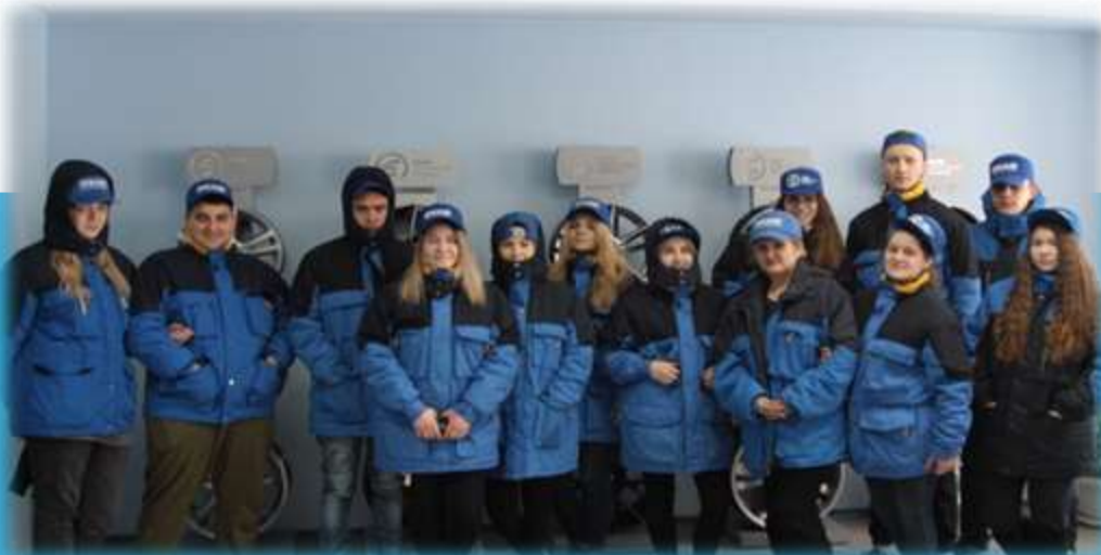
ООО «ЛМЗ «СКАД»